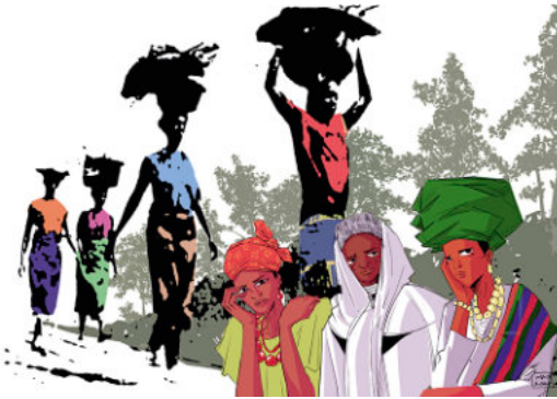
Illustration: „Rest for the weary“ (dt.: „Ruhe für die Erschöpften“) von der nigerianischen Künstlerin Gift Amarachi Ottah

In diesem Jahr begegnen wir dabei dem westafrikanischen Land Nigeria. Um 18 Uhr beginnt die Landesvorstellung. Danach geht der Abend über in den Gottesdienst. Im Anschluss sind alle eingeladen zum Beisammensein bei nigerianischen Speisen und Getränken.